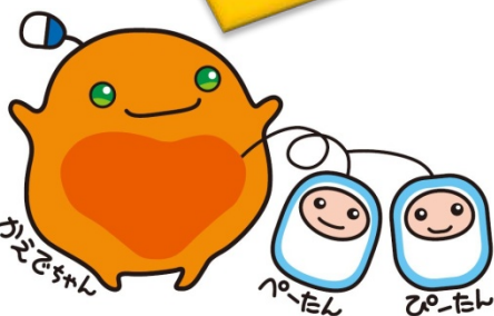
かえでちゃん (CAEDE: CPR AED Expert)は 心臓蘇生とAEDの普及をお手伝いするキャラクターです